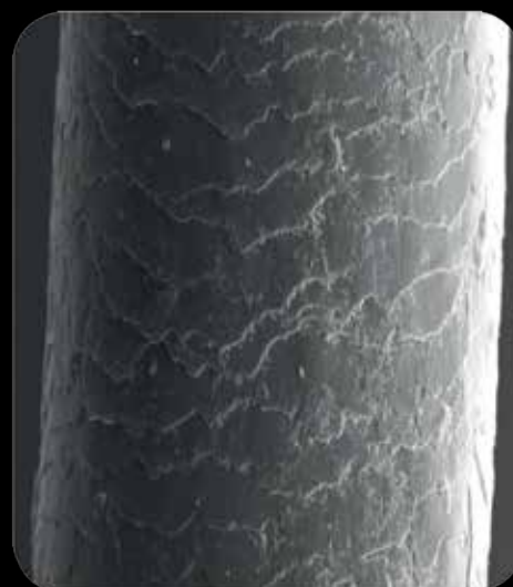
odbarvený vlas s iBLEACH plex