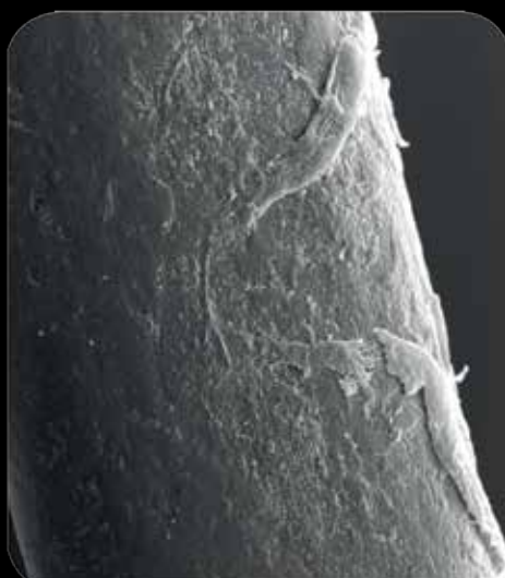
odbarvený vlas klasickým odbarvovačem